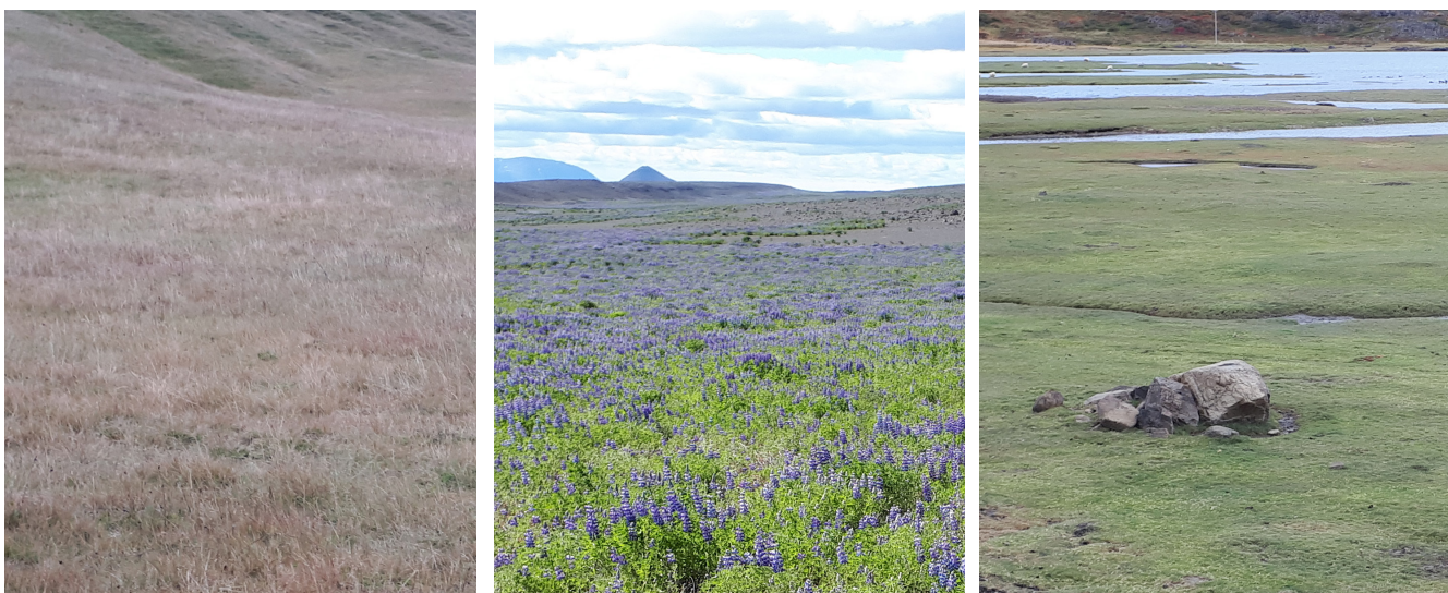
Mynd 5. Dæmi um landsvæði sem fá ástandseinkunn 22-26 í stöðumati GróLindar. Talið frá vinstri; starmóavist, alaskalúpína og sjávarfitjungsvist.