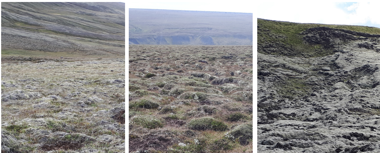
Mynd 4. Dæmi um landsvæði sem fá ástandseinkunn 17-21 í stöðumati GróLindar. Talið frá vinstri; hraungabravist, fléttu-móavist og mosahraunavist.