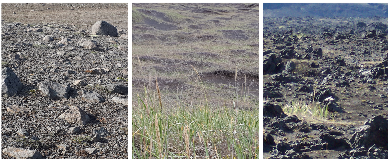
Mynd 2. Dæmi um landsvæði sem fá ástandseinkunn 5-12 í stöðumati GróLindar. Talið frá vinstri; eyðimelavist, landmelhólavist og eyðihraunavist.

eða mikið rof eða svæði með lága vistgerðaeinkunn og lítið rof. Þetta eru því svæði með lítinn stöðugleika og/eða litla virkni (Mynd 3). Svæði með einkunn 17-21 eru oftast með nokkra eða talsverða virkni og talsvert rof en geta einnig verið með litla virkni og lítið rof (t.d. mosavaxinn hraun) yfir í svæði með nokkuð háa vistgerðaeinkunn en rof er töluvert/mikið (t.d. vel gróin svæði með virkum rofabörðum) (Mynd 4). Svæði með einkunn 22-26 fá miðlungs einkunn fyrir vistgerðaflokk en eru með lítið rof eða svæði með háa vistgerðaeinkunn en nokkurt rof (t.d. mjög vel gróin svæði með einhverju rofi) (Mynd 5). Svæði með einkunn 27-30 eru svæði með háa einkunn fyrir vistgerð og lítið rof (Mynd 6) (Fylgiskjal II).