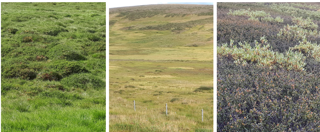
Mynd 6. Dæmi um svæði sem fá ástandseinkunn 27-30 í stöðumati GróLindar. Talið frá vinstri; fjalldrapamóavist, starungsmýravist og víðikjarrvist.